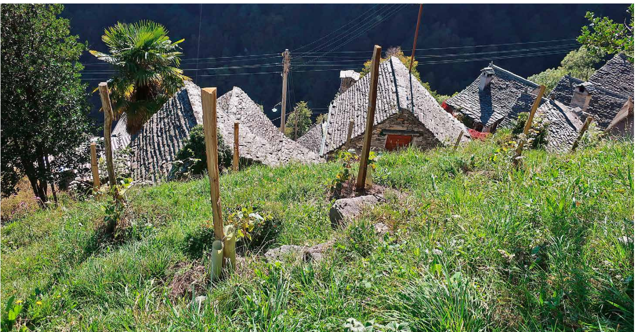
Vigneto di nuovo coltivato con il metodo della vite maritata sopra la frazione di Busada, a Mergoscia

La parcella nuovamente coltivata è parte integrante del sottoprogetto «Conservazione dei vigneti tradizionali», promosso dal FSP su scala più ampia con il nome «Rivalorizzazione ecologica del paesaggio terrazzato di Mergoscia». Fino a trent'anni fa la parcella era coltivata a vite, ma dopo il decesso del proprietario di allora i ceppi sono stati sradicati e sono stati messi a dimora agrifogli, i cui rami sono molto richiesti nel periodo prenatalizio e venduti nei mercatini di Natale; inoltre questo appezzamento fungeva da pascolo per pony. In tempi più recenti la