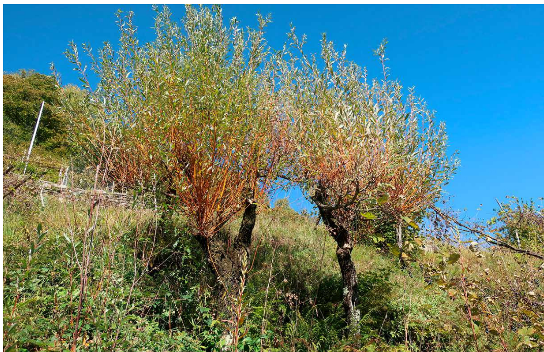
Salici con rami che si utilizzano per legare la vite

Grand-Saconnex (Canton Ginevra) per la piantumazione di alberi da frutto e di vecchie varietà di vite per la ricostruzione di un vigneto «hutin». In Ticino gli anziani ricordano ancora i loro nonni parlare della vite maritata e a Minusio si conservano gli ultimi testimoni di questo metodo di viticoltura.