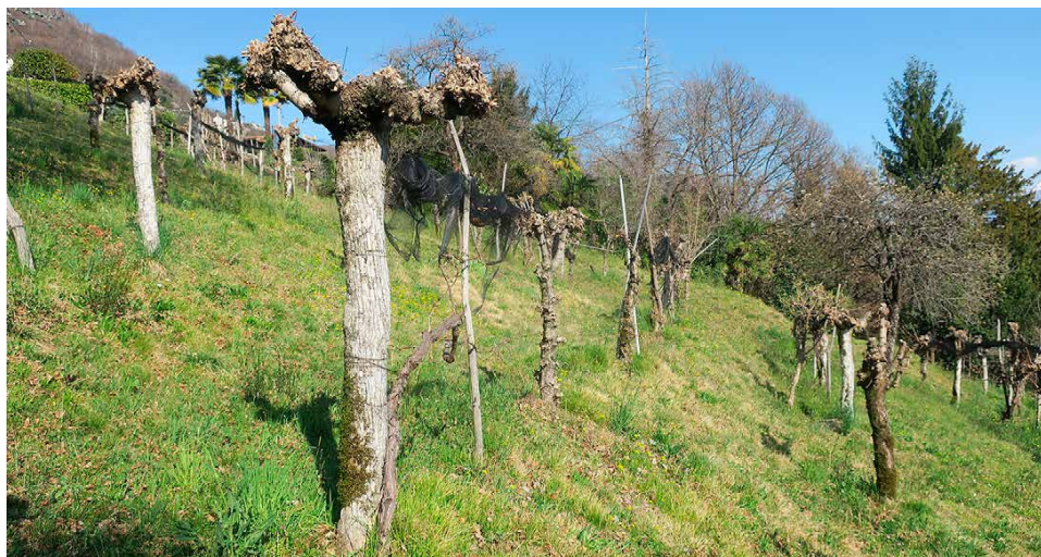
Ancora presente a Minusio: ultime testimonianze di un vigneto con la vite maritata