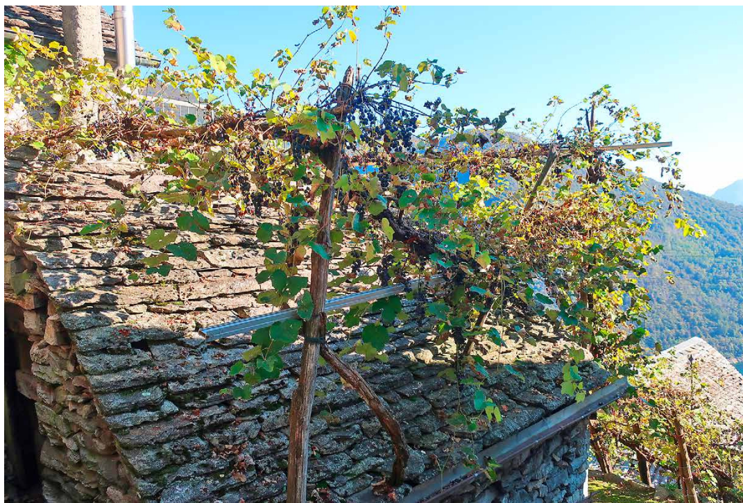
Come in passato, quando ogni lembo di terra doveva essere sfruttato: vite lasciata crescere sul tetto in pioda