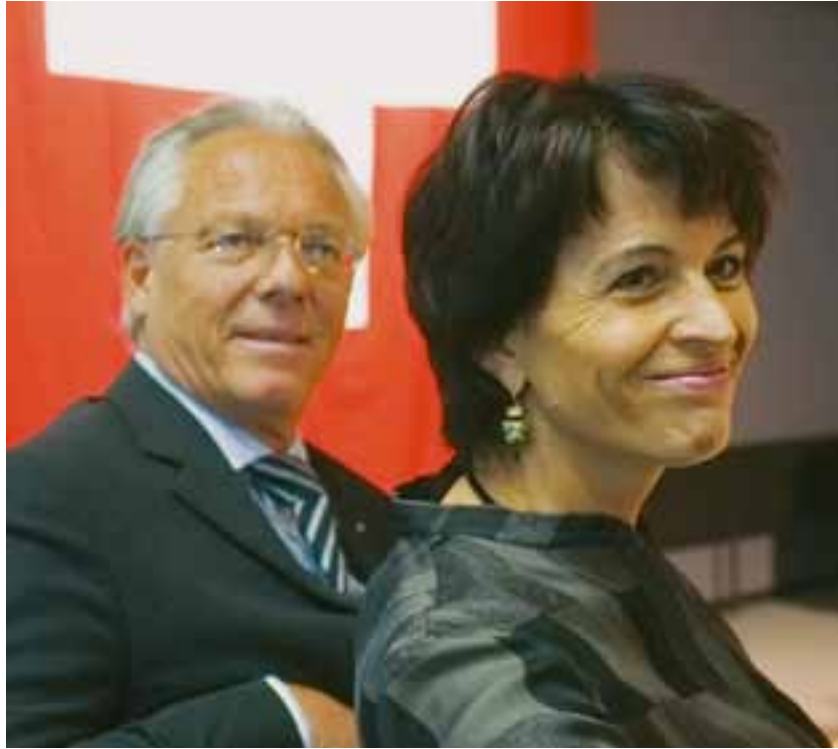
Bundesrätin Doris Leuthard und FLS-Präsident Marc F. Suter an der FLS-Jubiläumsfeier

Investir dans les paysages ruraux est une bonne décision. En effet : Les paysages sont des trésors de biodiversité, car ils abritent d'innombrables espèces animales et végétales. Cette fonction est d'autant plus importante que les listes rouges des espèces menacées ne se sont malheureusement pas raccourcies au cours des dernières années.