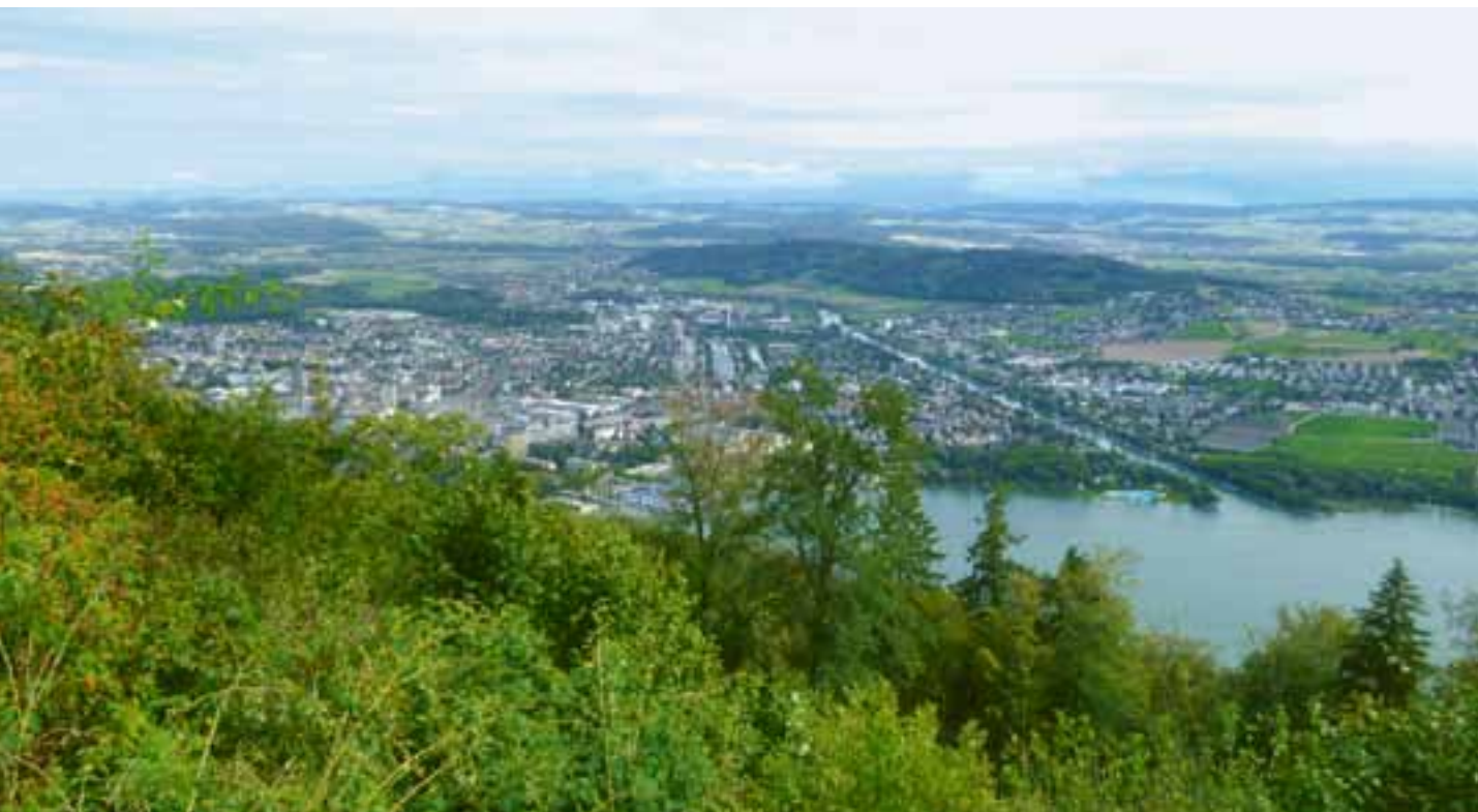
Ein Beispiel für die angesprochenen Agglomerationslandschaften: Ausblick vom Tagungsort Magglingen auf Biel/Bienne und Umgebung Un exemple des paysages d'agglomération évoqués : coup d'œil sur Biel/Bienne et ses environs depuis le lieu de la réunion, Macolin Un esempio dei paesaggi negli agglomerati, discussi proprio al convegno: veduta da Macolin su Bienne e dintorni

schen Gründen auf erneuerbare Energien umsteigen, wird Energie in der Landschaft sichtbar werden. Die grosse Frage ist nur, wie man damit vernünftig umgeht. Da kann es nicht darum gehen, per se alles abzulehnen, aber auch nicht alles zuzulassen. Es gilt, vernünftige Leitplanken für die Entwicklung zu setzen, beispielsweise Landschaftsräume festzulegen, wo keine Windräder hin sollen und wo man es sich auch leisten will, Hochspannungsleitungen in Erdkabel zu verlegen. Aber das wird nicht überall gehen, dessen müssen wir uns auch im Klaren sein.