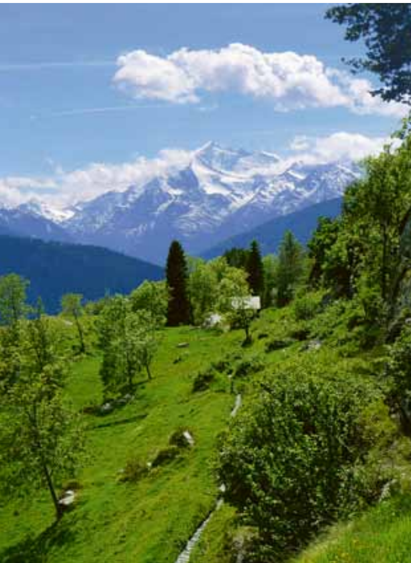
Ein Beispiel fürs Tätigkeitsfeld des FLS: Kulturlandschaft bei Mund VS

Und ich ermuntere Sie: Lassen Sie nicht nach in Ihrem Engagement. Wir werden Sie auch in Zukunft brauchen. Meine Unterstützung haben Sie.