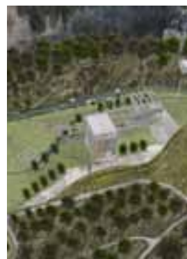
Landschaft im Wandel: Vor 50 Jahren noch eine Idylle, dann Industrie-Areal (Aufnahme von 1962) – und bald ein Park