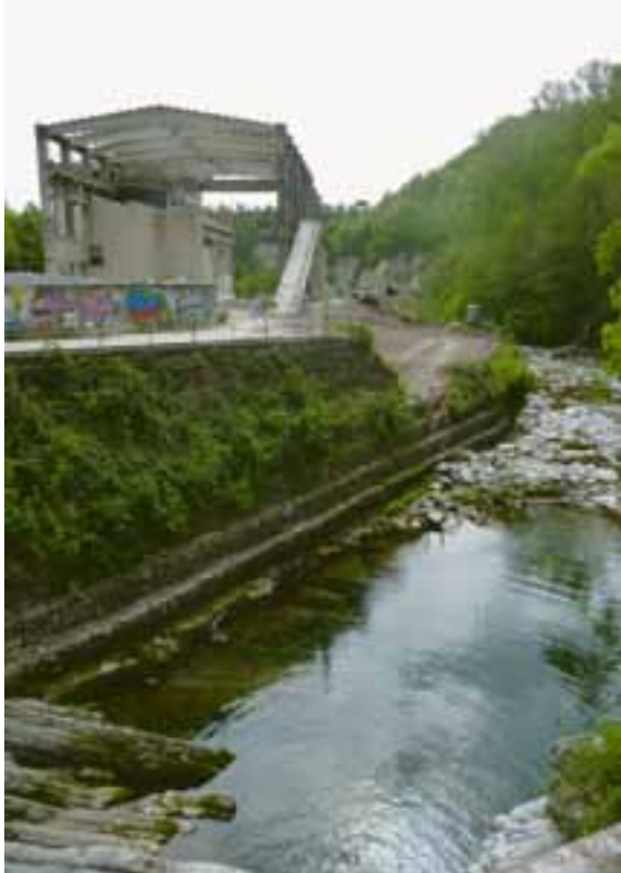
Überreste der Zementfabrik Saceba