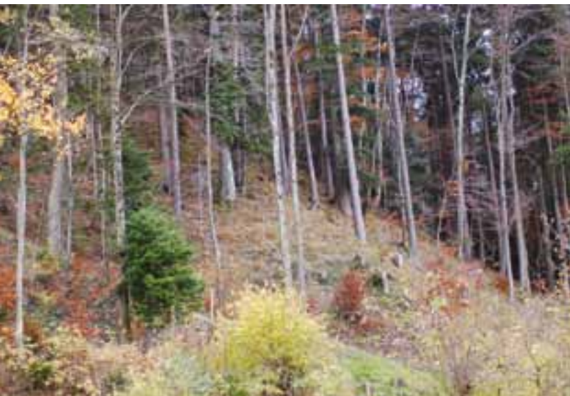
Ausgelichteter Waldsaum – ein Landschaftsbereich mit hoher Biodiversität