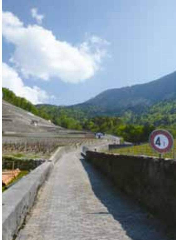
BLN-Gebiet von störenden Leitungsmasten befreit: Rebberge von Yvorne vor und nach Realisierung des FLS-Projekts

L'objet IFP a été débarrassé des pylônes électriques : vignoble d'Yvorne avant et après la réalisation du projet FSP