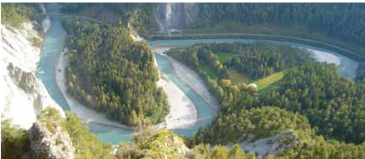
Rheinschlucht / Gorges du Rhin / Gola del Reno / Ruinalta

Der Bund wird damit in seinen raumwirksamen Sektoralpolitiken und bei seinen Aufgaben die Ziele des BLN besser umsetzen können. Zudem wird das BLN in der Richtplanung, und damit auch in der kommunalen Nutzungsplanung, stärker berücksichtigt sein.