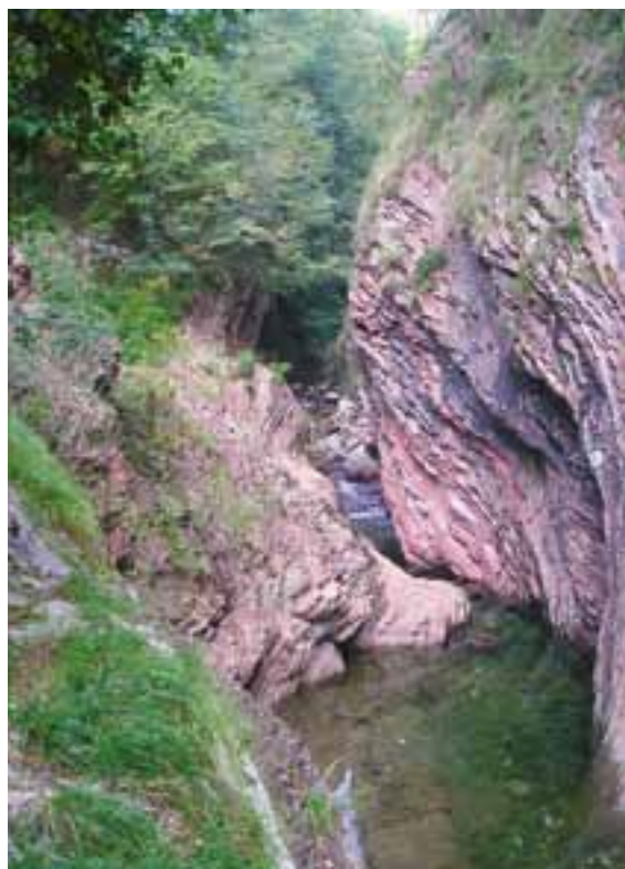
Eindrückliche Gesteinsschichten an der Breggia

Il cantiere, grigio e desolato, contrasta con l'esuberante vegetazione tutt'attorno: il terreno dell'ex fabbrica di cemento si trova nel bel mezzo del Parco delle Gole della Breggia, proprio dove le gole – intagliate dal fiume Breggia nella parte inferiore della Valle di Muggio – si aprono in una piccola valle, con dirupi ricoperti dal bosco e soprattutto con bellissime formazioni rocciose. Qui il fiume ha fatto affiora-