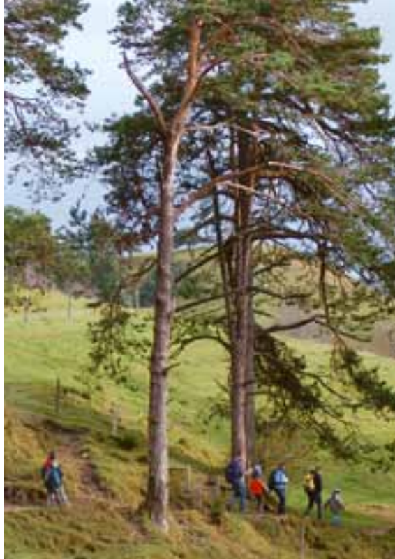
Föhrenweidewald – ein seltener Waldtypus, der gefördert werden soll

Margine boschivo diradato: una parte del paesaggio dall'elevata biodiversità