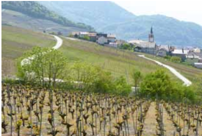
Leitungsfreies Landschafts- und Ortsbild von Yvorne

Le paysage et le site d’Yvorne sans lignes électriques